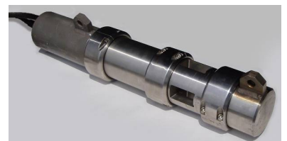
Disparador de Aire Comprimido