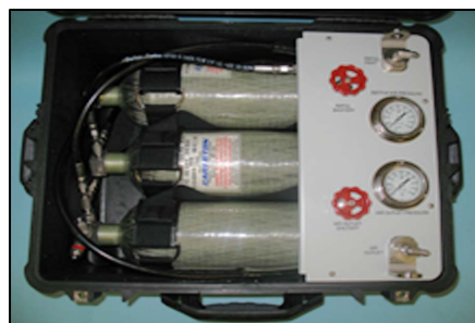
Botella(s) de aire de alta